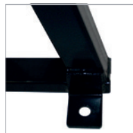
Sistema anclaje suelo Floor anchorage system