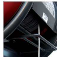
Final carrera superior Top limit switch