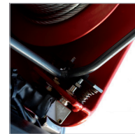
Final carrera superior e inferior / Top and bottom limit switch