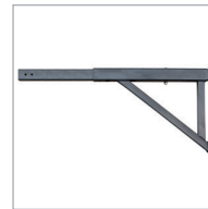
Soporte telescópico Telescopic support