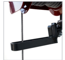
Final carrera superior Top limit switch