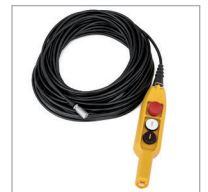
Botonera con 15 ó 30 m. de cable opcional / Optional hand control with 15 or 30 m. of cable