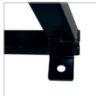
Sistema anclaje suelo Floor anchorage system