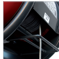
Final carrera superior Top limit switch