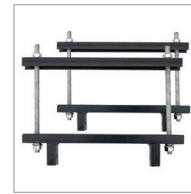
Fijación transversal Transversal fixation