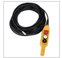
Botonera con 15 ó 30 m. de cable opcional / Optional hand control with 15 or 30 m. of cable