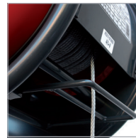
Final carrera superior Top limit switch

▪ Compact, robust hoist with an anti-fall chassis that can be installed on any beam.