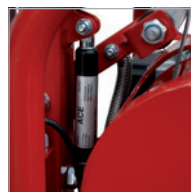
Final carrera superior e inferior Top and bottom limit switch