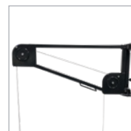
Reenvío con 5 posiciones horizontales Pulley arm with 5 horizontal blocking positions