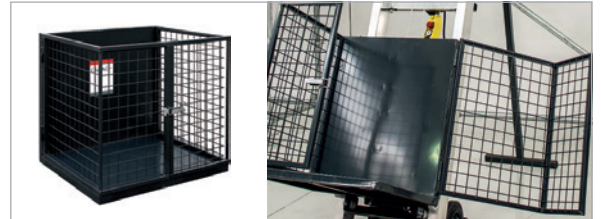
STANDARD CAGE / CAGE STANDARD 500 x 600 x 700 mm