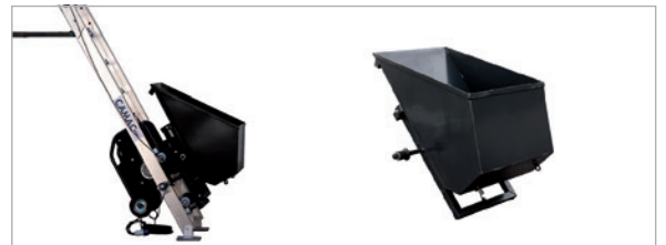
AUTOMATIC CONTAINER / BENNE BASCULANTE 70 L