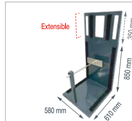
SOLAR PANEL PLATFORM TRANSPORTPLATTFORM FÜR SOLARMODULE