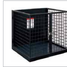
STANDARD CAGE / STANDARD-FAHRKORB 500 x 600 x 700 mm