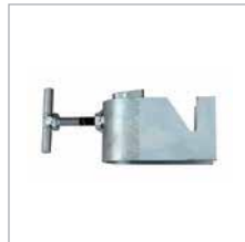
SCAFFOLDING CLAMP LEITERKLAMMER