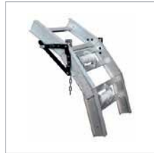
ARTICULATED SECTION KNICKSTÜCK