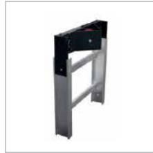
FINAL SECTION KOPFTEIL