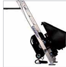
AUTOMATIC CONTAINER / AUTOMATISCHER BEHÄLTER 70 L