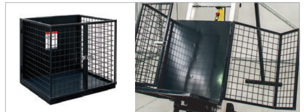
STANDARD CAGE /STANDARD-FAHRKORB 500 x 600 x 700 mm