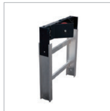
FINAL SECTION KOPFTEIL