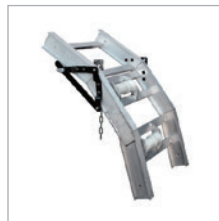
ARTICULATED SECTION KNICKSTÜCK