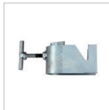
SCAFFOLDING CLAMP LEITERKLAMMER