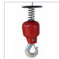
Security hook Crochet de sécurité