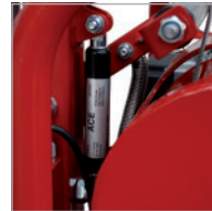
Top and bottom limit switch Fin de course supérieure et inférieure