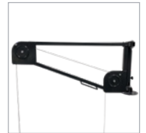
Pulley arm with 5 horizontal blocking positions Renvoi avec 5 positions horizontales