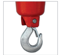
Security hook Crochet de sécurité