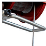
Final carrera superior Top limit switch

Designed for small, sporadic jobs, ideal for at-home work.