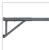
Telescopic support Support télescopique