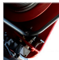
Top and bottom limit switch Fin de course supérieure et inférieure