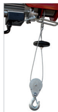
Upper guide pulley Renvoi supérieur